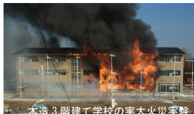
木造3階建て学校の実大火災実験

そこで本公開フォーラムでは、その他建築物・準耐火建築物・耐火建築物とした木造の福祉施設・幼児施設等について、その可能性と課題、設計の現状、今後の展望等を基調講演と4つの事例紹介を通じて議論したい。