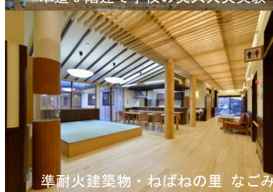
準耐火建築物・ねばねの里 なごみ