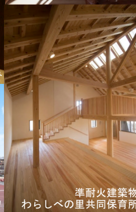
準耐火建築物 わらしべの里共同保育所