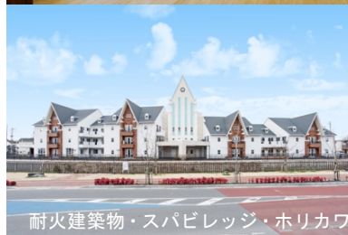
耐火建築物・スパビレッジ・ホリカワ