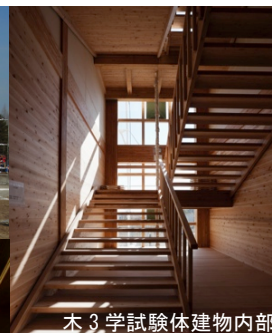
木3学試験体建物内部