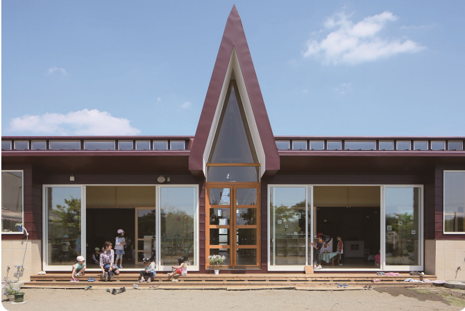
ひかりの子幼稚園